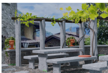
Gestaltungsvorschlag Visualisierung »Expert«