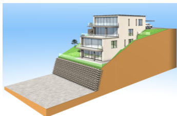
Gestaltungsvorschlag Visualisierung »Light«